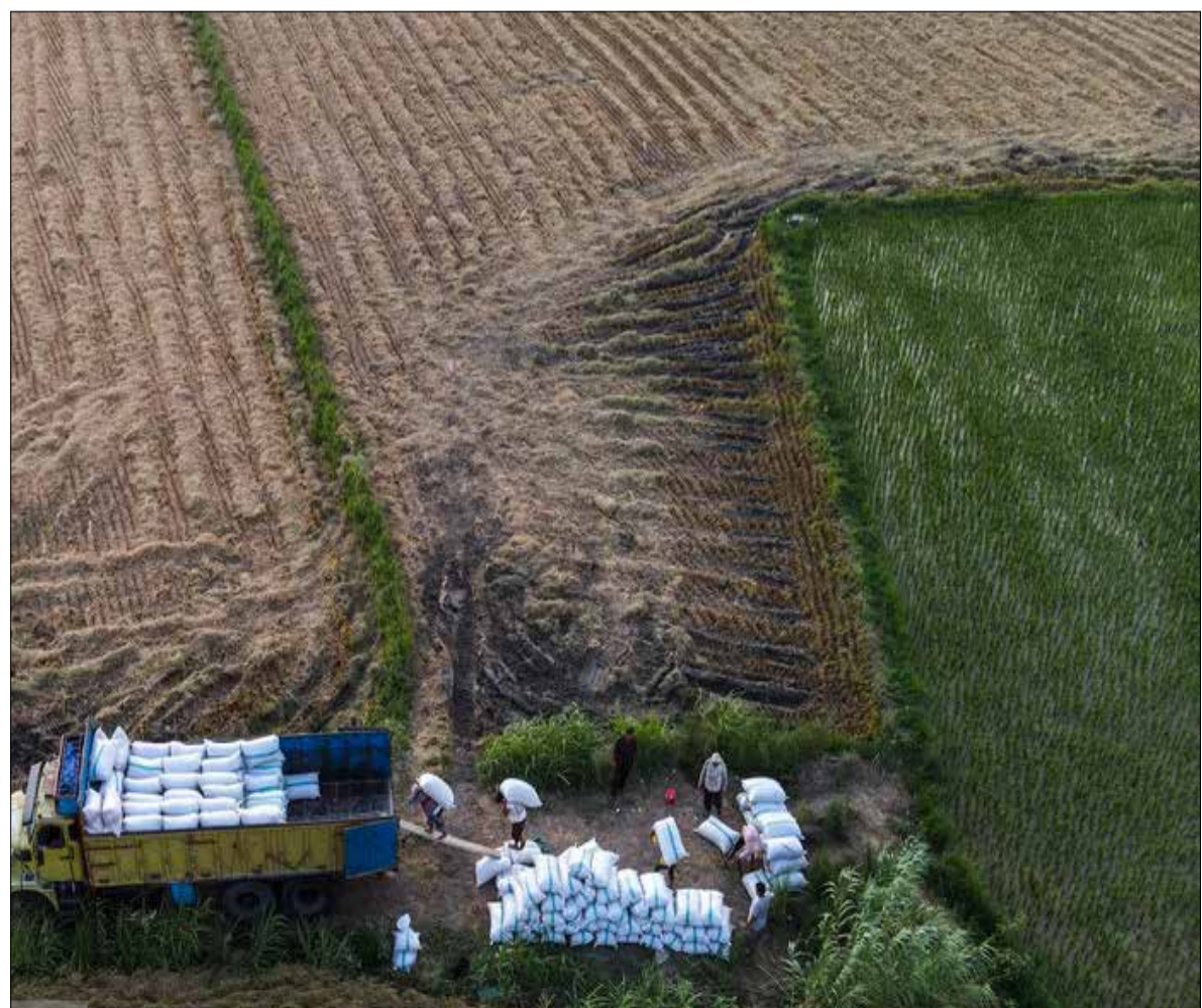
عکس منتخب هفته