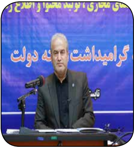
مدیر عامل آبفای مازندران در نشست با مدیران عامل شرکت آب و فاضلاب استان

مدیر عامل شرکت آب و فاضلاب مازندران در ادامه سخنانش با اشاره به آغاز عملیات اجرایی ۱۴ طرح آبرسانی و فاضلاب در سطح استان گفت: عملیات اجرایی حفر و تجهیز ۷ حلقه چاه با ابدهی ۲۴۰ لیتر در ثانیه، اجرای خط انتقال به طول ۱۴۹۰۰ متر، احداث ۲ باب مخزن ذخیره به حجم ۱۳۰۰ متر و اجرای شبکه اصلی و فرعی فاضلاب به طول ۹ هزار متر با برآورد اعتباری بالغ بر ۱۲ هزار و ۷۰۲ میلیارد ریال در استان شروع می‌شود که پس از اتمام و بهره برداری ۷۷۸ هزار و ۸۲۵ نفر از مزایای این طرح‌ها بهره مند خواهند شد.