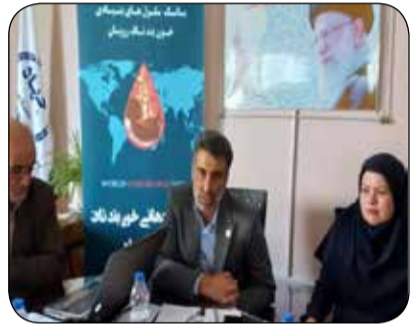
نوزاد جمع آوری می‌شود و اگر جمع آوری نشود این خون دور ریخته می‌شود.

ضرابی حجم خون بند ناف را ۸۰ تا ۲۰۰ میلی لیتر عنوان کرد و گفت: این خون پس از تولد