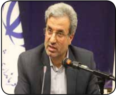
مدیرکل تعاون، کار و رفاه اجتماعی مازندران از