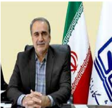
Scopus, WOS, ISC ضروری است.

این مسوول با اعلام این مطلب که بررسی اعطای پایه تشویقی در دانشگاه مازندران انجام شد، در خصوص روند بررسی‌های انجام شده، گفت: پیرو درخواست متقاضی، مدارک و مستندات ارائه شده، بررسی و پس از طرح در